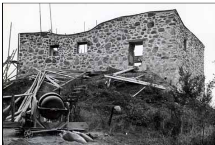
Ruinen före och efter 1961 års restaurering.

En del smärre insatser gjordes av NCC Öst i Tranås. Löst fogbruk rensades bort och ersattes med hydrauliskt kalkbruk från Stråbruket AB. Raserade murpartier murades upp med sten från säteriets marker. Sprickorna över fönsteröppningarna i öster åtgärdades inte. Omkring 2003 insatte fastighetsägaren stöttor i alla fönster för att förhindra ras.