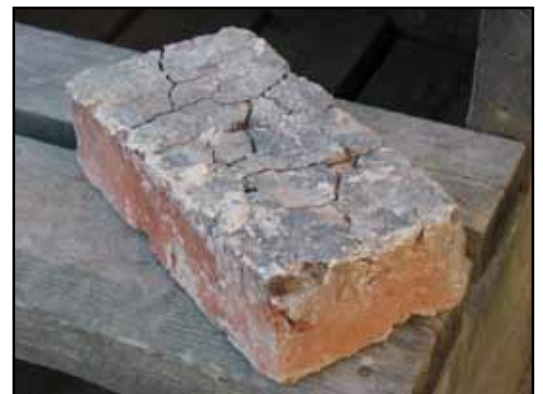
Två prov på vid tidigare restaureringar återanvänt tegel från byggnadstiden, båda med rester av sot sokm indikerar att de ursprungligen suttit i murstockar. Den övre bilden visar ett påfallande tunt tegel som för tankarna till flensburgtegel, det undre ett vanligt stortegel.