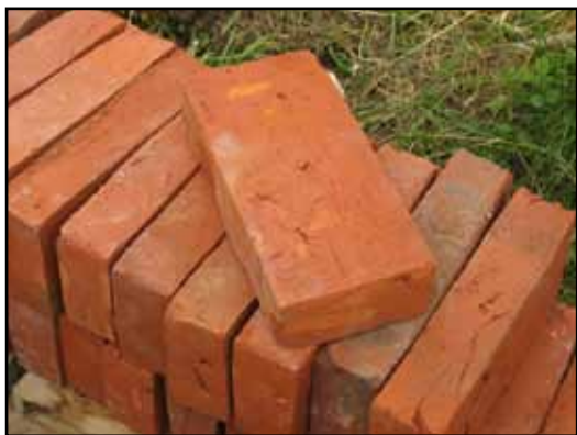
Fönstersmygarnas sidor lagades med handslaget lertegel från Sindal i Danmark.