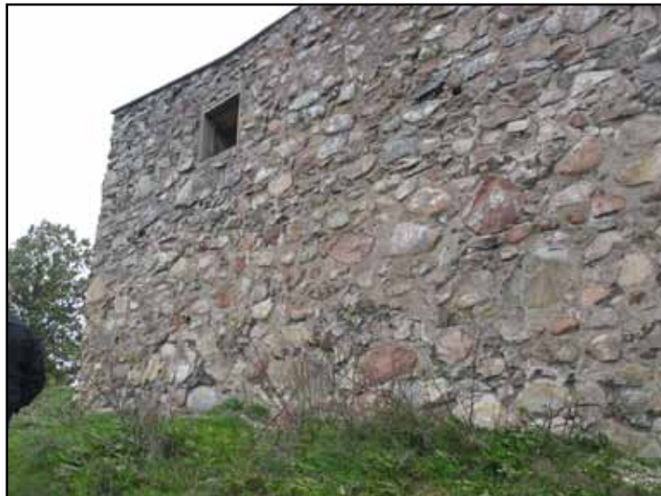
Södra murens utsida efter restaurering.