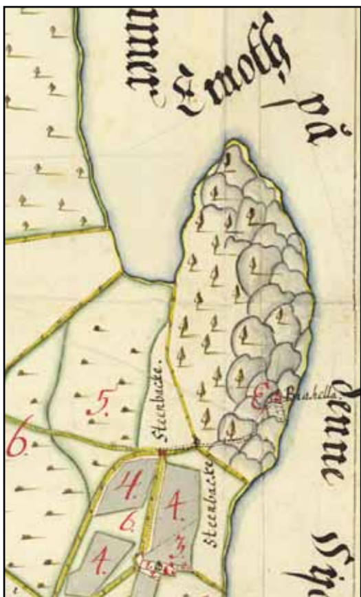
Utsnitt ur geometrisk avmätning av Näs säteri från 1700 i Lantmäteristyrelsens arkiv. Vägen från sätesgården är i princip densamma som idag.

Visingsborgs räkenskaper ger en del information kring Brahehällans uppförande. År 1677 anlades en såg på Näs ägor, vilket Erik Lönnerholm (1967) ser som förarbete till byggnationen. År 1680 levererades totalt 105 tunnor kalk till säteriets befallningsman. Själva uppmurningen av lustslottet skedde sommaren detta år under ledning av Måns murarmästare från Hultsbäcken i Bälaryds socken. Den snabba byggtiden kan förklara murverkets påtagliga enkelhet. Dess uppförande som skalmurar började bli ett föråldrat byggnadssätt under 1600-talets andra hälft då fullmurar av tegel blev vanligt förekommande i adligt byggande. Detta skulle kunna ses som ett tecken på Per Brahes konservatism i byggnadsfrågor. Likväl anammade han det italienska lanternintaket i palladiansk anda och använde det även för en så anspråkslös byggnad som Brahehälla. År 1681 inköptes spik för "spåning" av taket. Uppenbarligen spåntäcktes taket, vilket vederlägger uppgiften om kopparplåtstäckning. Vid detta laget hade dock Per Brahe gått ur tiden och reduktionen var ett faktum.