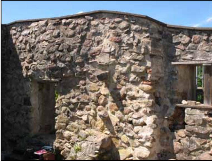
Insidan av västmuren. Hela inre skalmuren över porten var på väg att kalva ut.