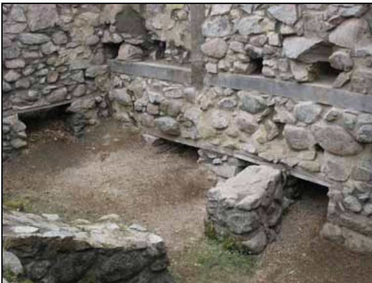
Ovan: källaren har efter rensning blivit mer lättavläst. T.h: sista delen av återuppmurningen av murpartiet mellan de båda fönstren i öster.