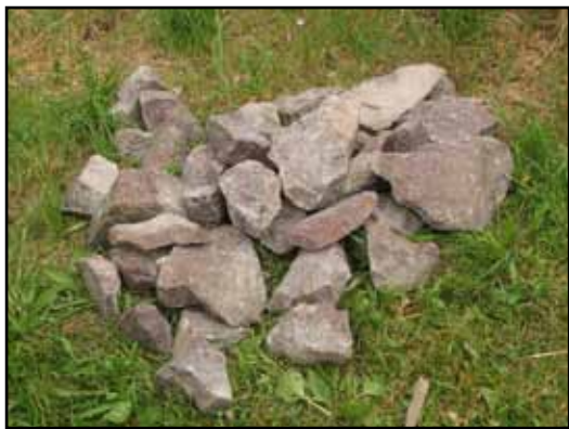
Kompleterande sten för skolning och armering hämtades lokalt och håller samma kulör som befintlig sten.