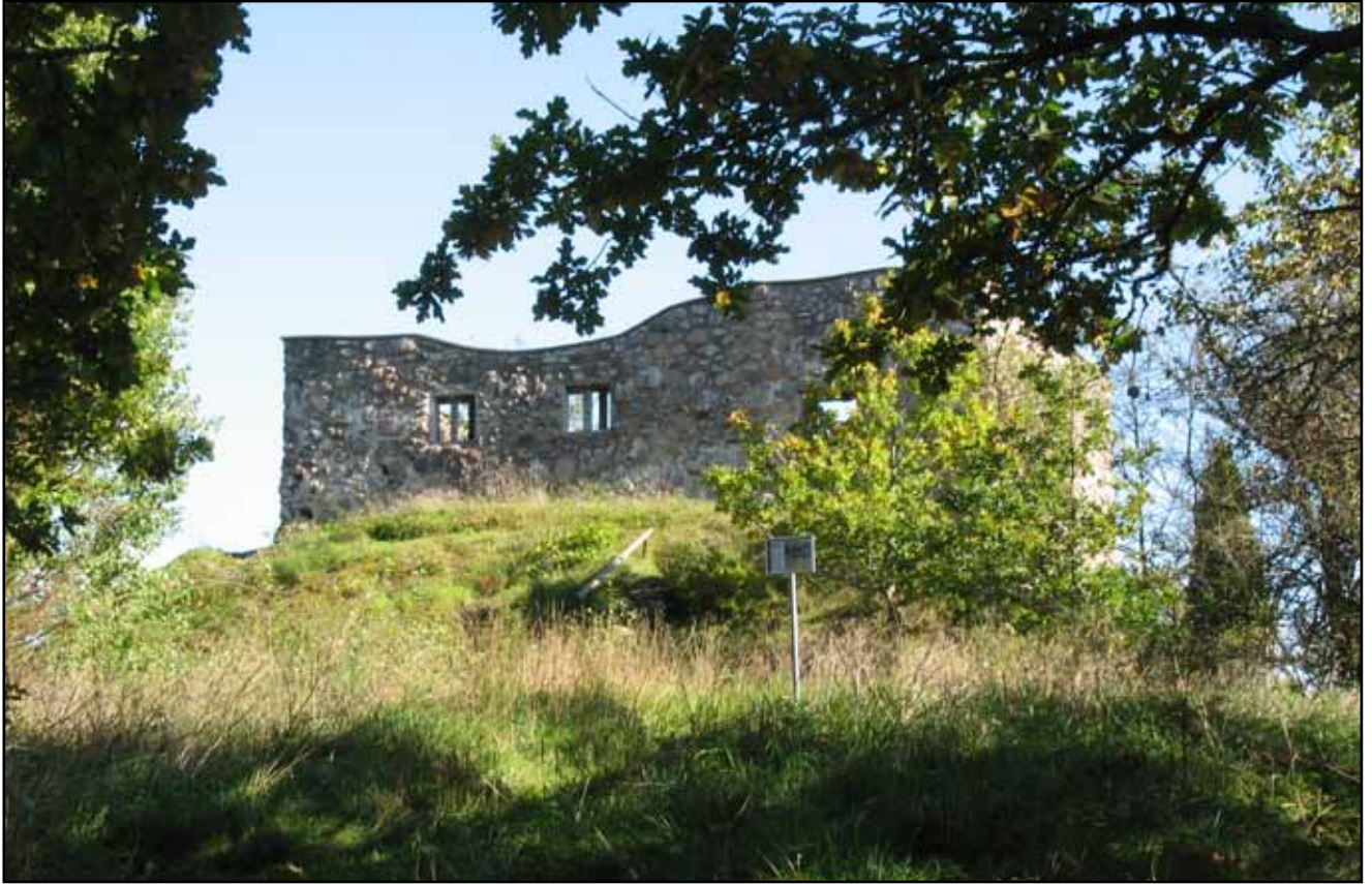
Brahälla slottsruin fotograferad 2008. Observera att fönsteröppningarna stöttats upp med plank för att förebygga ras.