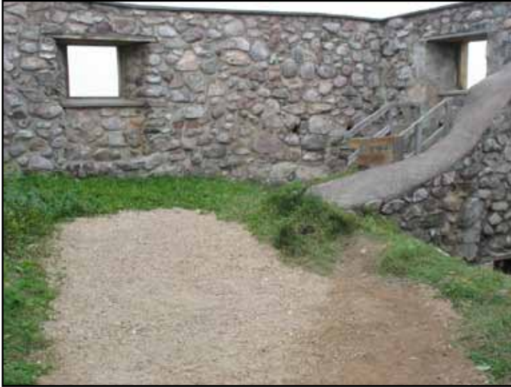
Ruinens inre mot norr efter restaurering. En svacka i marken är utfylld med finfördelat äldre bruk.