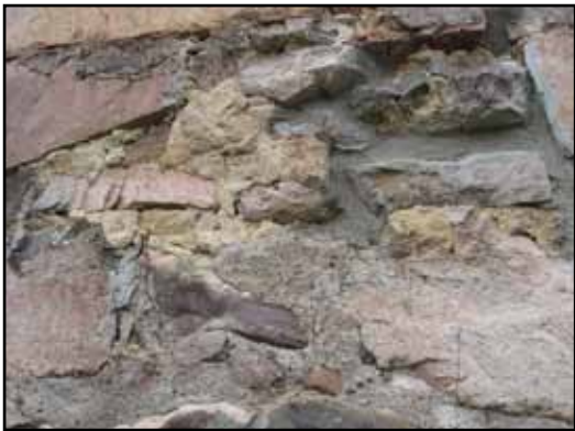
Ett av få murpartier med bevarade originalfogar finns nära sydvästra hörnet.