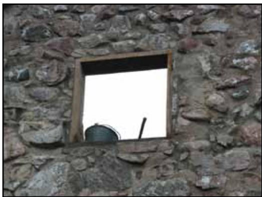
Södra fönstret med nya sågade ekkarmar.

Fogarna är idag ganska jämnt gråa och härrör till största delen från 1961. Överlag har de inte tillåtits smeta ut över de exponerade stenytorna. Dessa hårda kalkcementfogar har i många fall släppt från stenarna, vilket i kombination med urlakning av bakomvarande kalkputs lett till lösa och nedfallna stenar. Vid urkratsning visade det sig dock att själva murkärnan av kalkbruk på många ställen ännu har kvar sin styrka ett stycke in. Partiellt förefaller dock ordentlig bruksfyllning i murkärnan att saknas. Överlag finns tendenser till att murkärnan i ruinens väggar är dålig och kanske t o m redan från början varit ett bristfälligt arbete, vilket förvärrats genom urlakning. Detta är viktigt att ha kännedom om inför framtida vård och underhåll av ruinen. Uppstår på nytt större sprickbildningar och lösa partier är risken för ras överhängande. 1900-talets restaureringar har endast i mycket begränsad omfattning murat om intakta murpartier. Stenmaterialet är av överlag av modest storlek, man har rimligen nyttjat lokal marksten av behändig storlek för bygget, sannolikt motiverat av det svårtillgängliga läget.