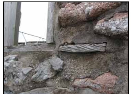
Rest av ursprunglig fönsterbänk på östfasaden.