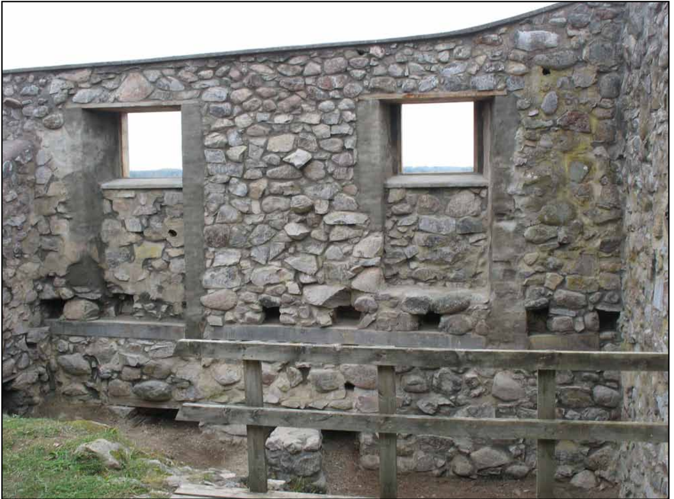
Den östra murens insida efter restaurering. Partiet mellan fönstren i bild är nästan helt ommurat från samma nivå som högra fönstermursens botten. Även över fönstren är murverket ommurat från insidan och nya ekplank inlagda. Tegelmattningarna har lagats och slammats. I öppningen efter det försvunna bjälklaget har stabiliserande ekbjälkar monterats.