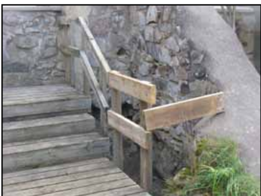
Mellanväggens nordsida förutsätter omfattande om-murning. Detta arbete hanns inte med under 2010 och avser utföras under nästa år. Ett tillfälligt träräcke sattes upp.

En svacka i ruinens västra del fylldes upp med kasserade bruksmassor. Vedartad växtlighet avlägsnades och bör årsvis hållas efter.