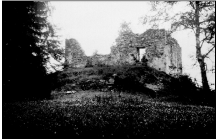
Brahälla i sitt längst gångna förfall.

förslag. På hans fotografier syns att västra fasaden delvis rasat till nivå med fönstrens nederkant.