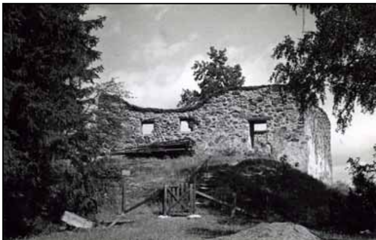
Brahälla efter den första restaureringen, Murkrönen är enbart avtäckta med grästorv.